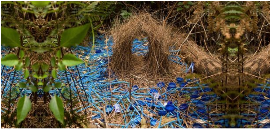
Le wiithaa, ou bowerbird en anglais, a tout compris. Cet oiseau polygame utilise les déchets qui l'entourent comme ressources pour fabriquer des nids colorés et charmer les femelles.